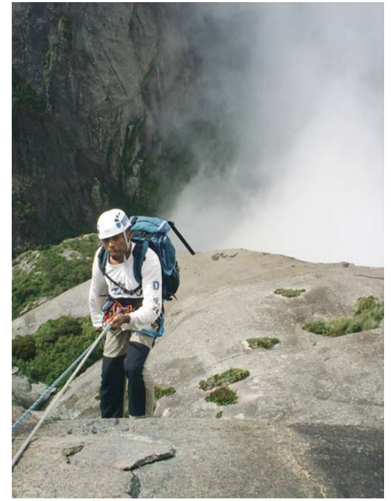
Até na hora de rapelar o escalador pode se complicar se não conhecer bem a via