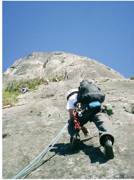
Salinas: Olhar para cima e ver que ainda tem muita parede pela frente