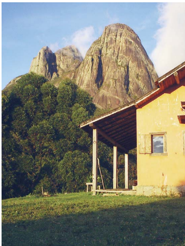
Um dos campings localizados na região de Salinas