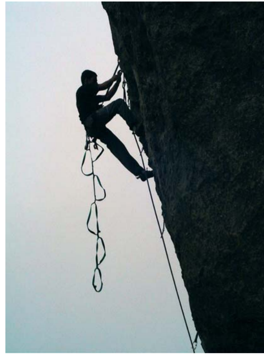
Silhuetada, a escalada artificial na Caixa de Fósforos, Vale dos Frades