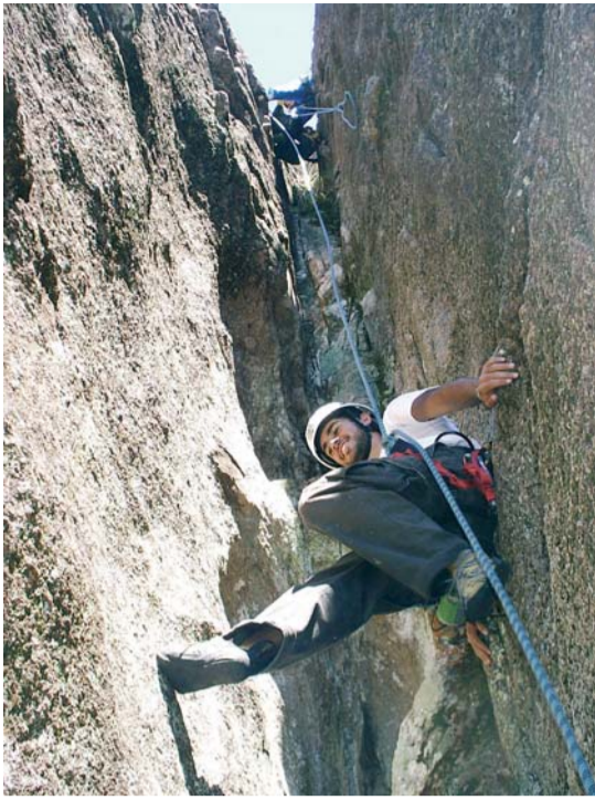
Chaminé no Pico Maior, uma das montanhas mais procuradas da região